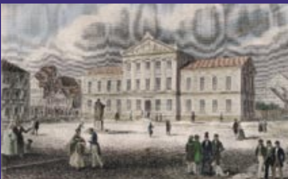
Aula der Universität Göttingen, Stahlstich um 1850.

In einem eigenen Internet-Portal ( www.goettinger-sieben.info ) werden begleitend zur Ausstellung ausführliche Informationen sowie Texte und Unterrichtsmaterialien zum Thema Göttinger Sieben ® bereitgestellt. Außerdem ist ein reich bebildertes Begleitband mit Quellen und Dokumenten zum Protest und seinen Folgen erschienen.