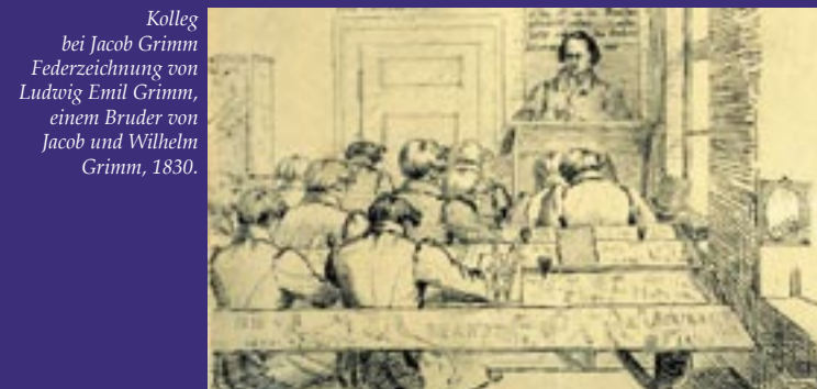
Kolleg bei Jacob Grimm Federzeichnung von Ludwig Emil Grimm, einem Bruder von Jacob und Wilhelm Grimm, 1830.

Die Schau charakterisiert die sieben Professoren und ihre durchaus unterschiedlichen Motive für die Opposition gegen den König. Sie fängt die Atmosphäre der Universitätsstadt Göttingen ein und zeigt, wie Studenten mit ihren Schreibfedern, Schriftsetzer und Drucker mit ihren Zeitungen und Aufrufen die Protestation der »Sieben« in ganz Europa zu einem Medien-Ereignis machten.