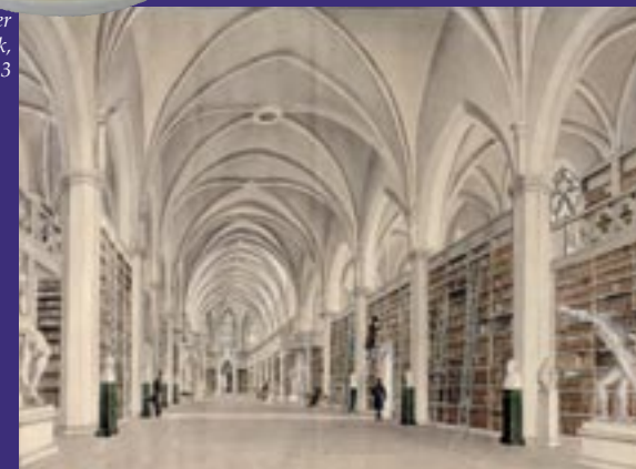
Göttinger Universitätsbibliothek, Aquarell vor 1823