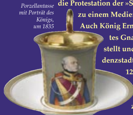
Porzellantasse mit Porträt des Königs, um 1835

Die facettenreiche Ausstellung Göttinger Sieben ® vereint zahlreiche zeitgenössische Gemälde und Graphiken sowie kostbare Kunst- und Gebrauchsgegenstände, die z.T. erstmals öffentlich zu sehen sind. Rauminszenierungen und Medienangebote verdeutlichen die Auseinandersetzungen, die vor 170 Jahren um Staatsverfassungen und Treueschwüre geführt wurden.