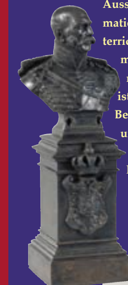
Kleine Büste des Königs, Eisenguss, um 1845

In einem eigenen Internet-Portal ( www.goettinger-sieben.info ) werden begleitend zur Ausstellung ausführliche Informationen sowie Texte und Unterrichtsmaterialien zum Thema Göttinger Sieben ® bereitgestellt. Außerdem ist ein reich bebildertes Begleitband mit Quellen und Dokumenten zum Protest und seinen Folgen erschienen.