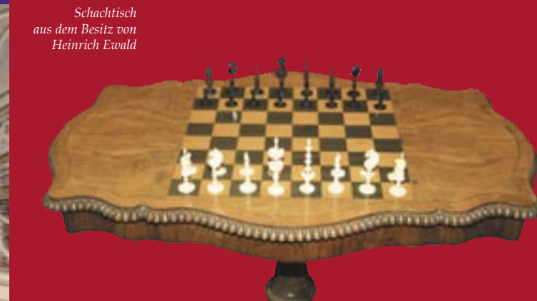
Schachtafel aus dem Besitz von Heinrich Ewald

In diesem Ausstellungsprojekt arbeiten das Städtische Museum Göttingen und das Historische Museum Hannover eng zusammen. Die Ausstellung wird am 27. Januar 2008 eröffnet und ist bis zum 13. April im Städtischen Museum Göttingen zu sehen.