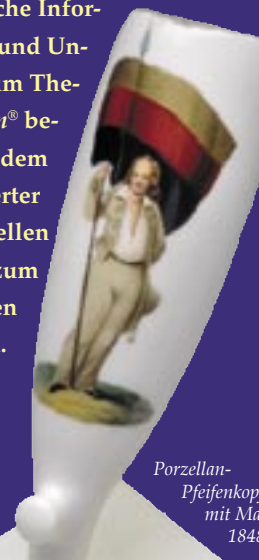
Porzellan-Pfeifenkopf mit Malerei, 1848